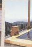
10帖、6帖、茶室、水屋のあるお部屋です。岩露天風呂。